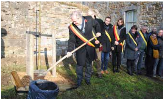
Plantation de l'arbre du souvenir à Scaltin